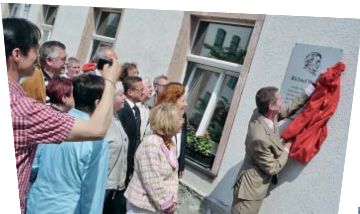
Enthüllung der Richard Wagner Gedenktafel