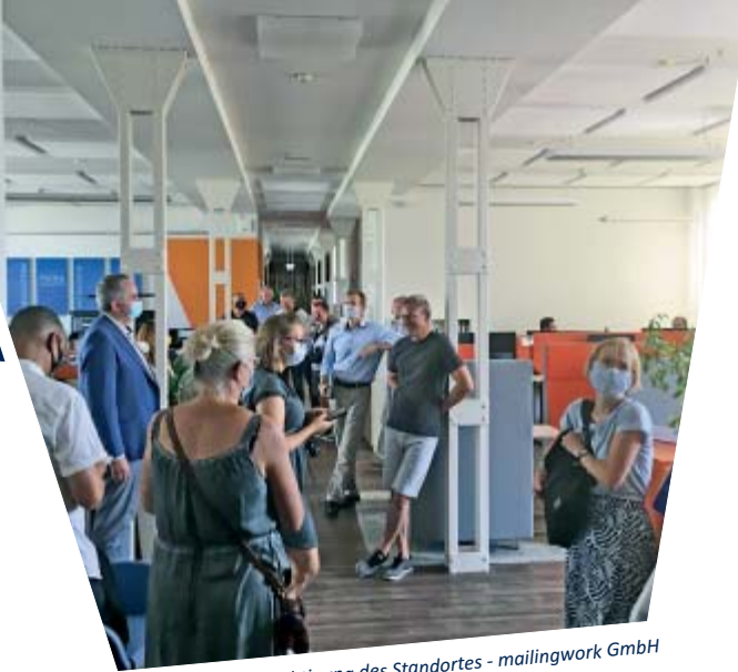
Pressefahrt und Besichtigung des Standortes - mailingwork GmbH