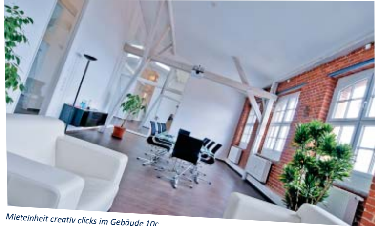
Mietereinheit creativ clicks im Gebäude 10c

Das Jahr 2013 stand für die Musikwelt im Zeichen des 200. Geburtstags von Richard Wagner (1813 - 1883). Der Chemnitzer Richard-Wagner-Verband weihte am 20. Mai 2011 eine Tafel zum Gedenken an den Komponisten ein. Sie erinnert am Gebäude 5 (Eingang A) daran, dass Wagner dort vom 7. zum 8. Mai 1849 Unterschlupf bei seiner Schwester Clara Wolfram fand, die damals in diesem Haus lebte. Wagner beteiligte sich in Dresden an den Aufständen gegen den König und musste deshalb emigrieren. Von Chemnitz aus gelang ihm die weitere Flucht in die Schweiz, wo er Teile des „Ring der Nibelungen“ vollendete.